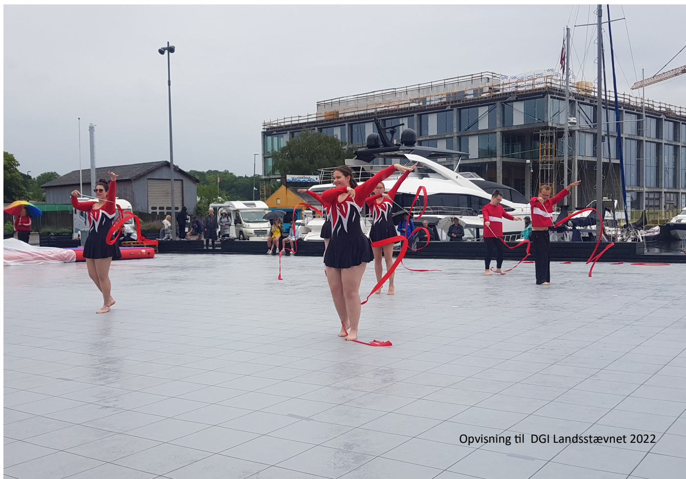
Opvisning til DGI Landsstævnet 2022